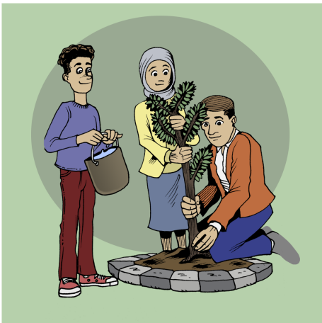
BEŞDARIYA ÇALAKIYÊN CIVAKÎ Û MALBATÊ BIKIN