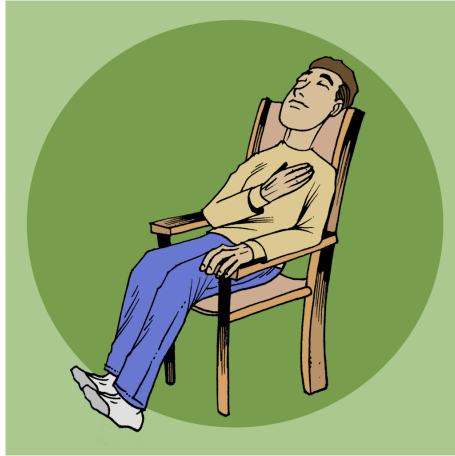
BIKIN SISTÎ Û PONIJÎNI