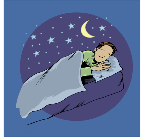
BÎNIN BÎRA XWE KU HÛN XWE RIHET BIKIN