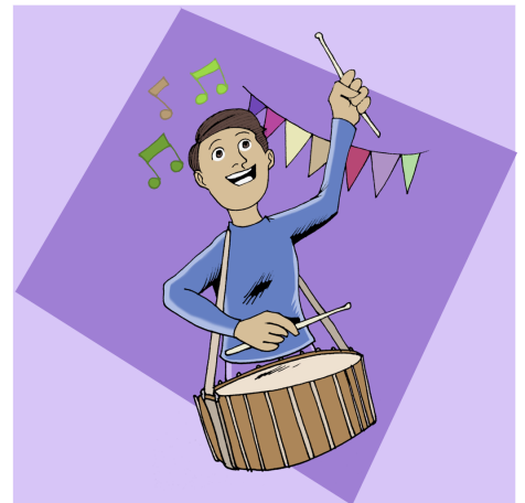
KÊFÊ BIKIN DI DELÎVEYAN DE