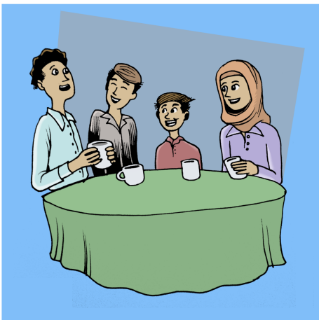
WEXT DERBASKIN BI MIROVÊN HÛN JI WAN HEZ DIKIN