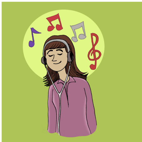
GUHDAR BIKIN LI MUZIKA KU HÛN DIXWAZIN