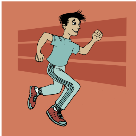
XWE PERWERDEBIKIN BI RÊZDARI