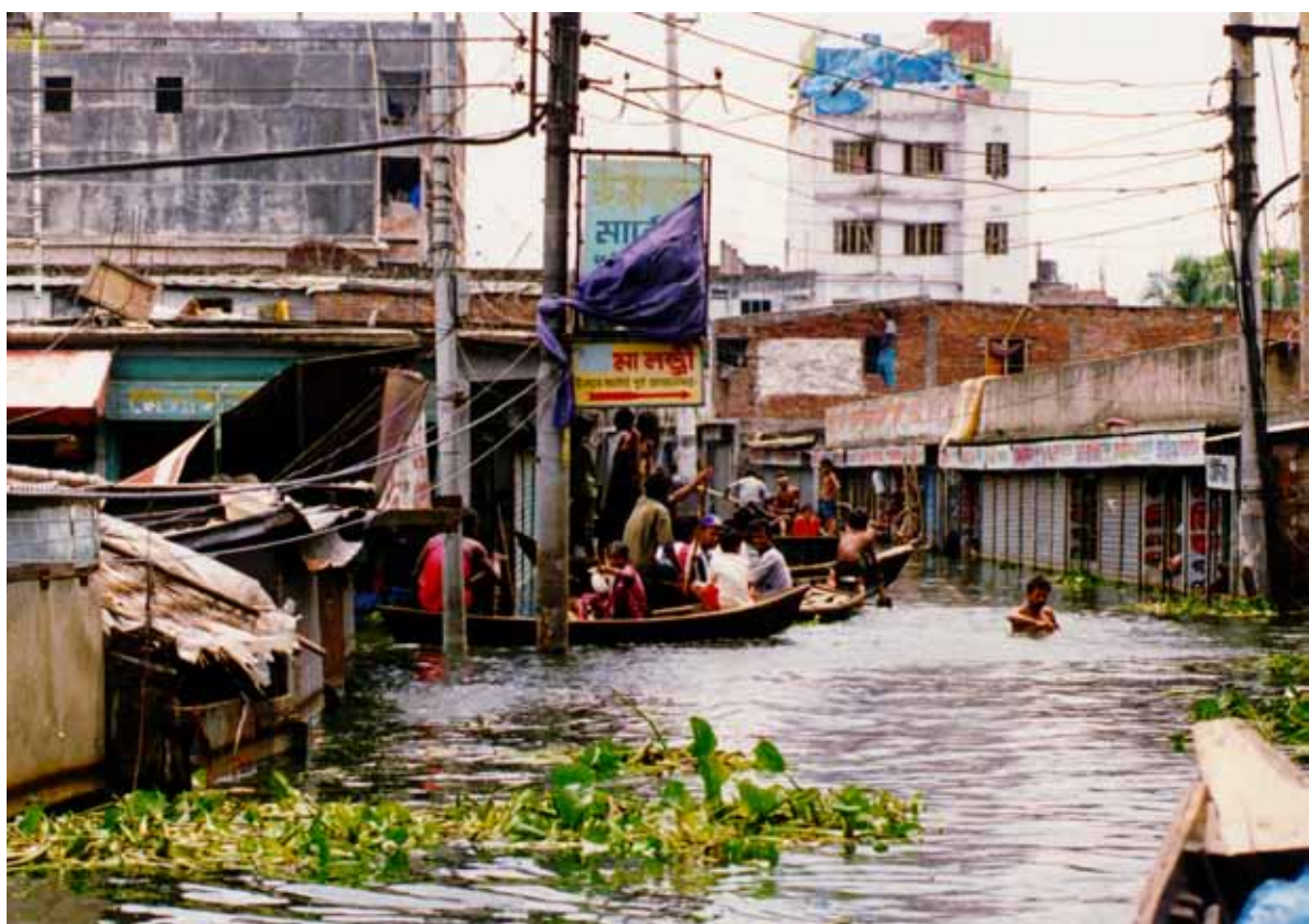
Víctimas de la inundación rescatadas y transportadas en barca por las calles principales, Bangladesh.

Existen tres áreas de preocupación creciente en lo referente al cambio climático y su relación con la salud mental. En primer lugar, es muy probable que los impactos directos del cambio climático, como los fenómenos climáticos extremos, tengan consecuencias inmediatas en la salud mental. En segundo lugar, la población vulnerable empieza a experimentar trastornos en los factores sociales, económicos y ambientales que favorecen la salud mental. Por último, cada vez se comprenden más las maneras en que el cambio climático, en tanto que supone una amenaza medioambiental global, puede crear ansiedad sobre el futuro.