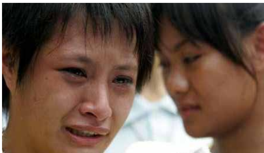
Centro de Evacuados Chishan, Sur de Taiwán. 15 de agosto de 2009. El tifón Morakot provocó en Taiwán las peores inundaciones en décadas.

a las comunidades para usar sistemas de alerta temprana, es una manera de hacerlo. También existe una necesidad de evaluar qué aspectos de la vulnerabilidad están relacionados con el bienestar psicosocial de los individuos y comunidades, para saber cómo aumentar su resistencia. Si una comunidad tiene una fuerte red social, será capaz de afrontar los problemas conjuntamente, y es importante estudiar mejor estos aspectos. En las áreas urbanas, las redes sociales y comunitarias son diferentes, y a medida que una mayor proporción de la población mundial