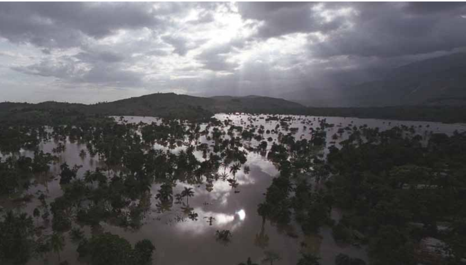
Inundaciones en Haití.

trada hasta la fecha. Más del 90% fueron debidos a condiciones climáticas extremas o a sucesos relacionados con el clima, originando el 95% de las 16.000 muertes registradas.