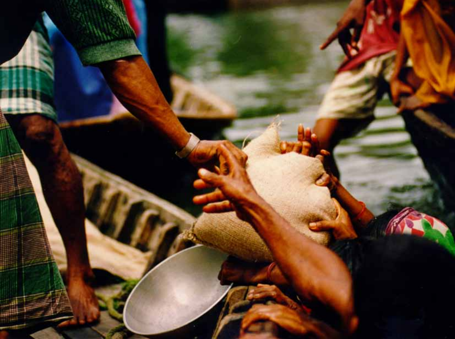
Inundaciones en Bangladesh.