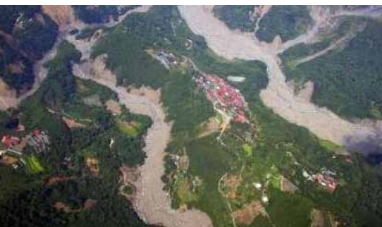
Un pueblo de montaña en el condado de Chiayi, al sur de Taiwán, rodeado de inundaciones tras el tifón Morakot, el 18 de agosto de 2009.

El concepto de “alerta temprana - acción temprana” describe cómo las predicciones meteorológicas pueden ayudar a planificar desastres como inundaciones o sequías. Las predicciones de cambio climático, como las de posibles