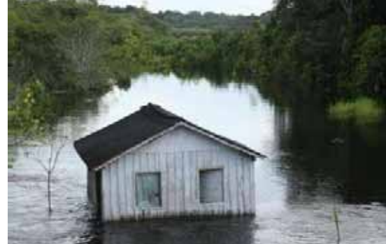
De izquierda a derecha: (1) Equipo de rescate intentando recuperar a un hombre, arrastrado por la inundación, a medida que tifón Morakot se acerca a Shangai (China) el 1 de agosto de 2009. (2) Jeseník nad Odrou (República Checa) 25 de junio de 2009. Equipos de rescate y voluntarios evacúan a una mujer de su casa inundada. (3) Estado de Amazonas (norte de Brasil), 18 de mayo de 2009. Las inundaciones y corrimientos de tierras tras meses de intensas lluvias desplazan a más de 300.000 personas de su hogar y matan al menos a 44.

y también debemos atajar este tipo de vulnerabilidades en el contexto del cambio climático.