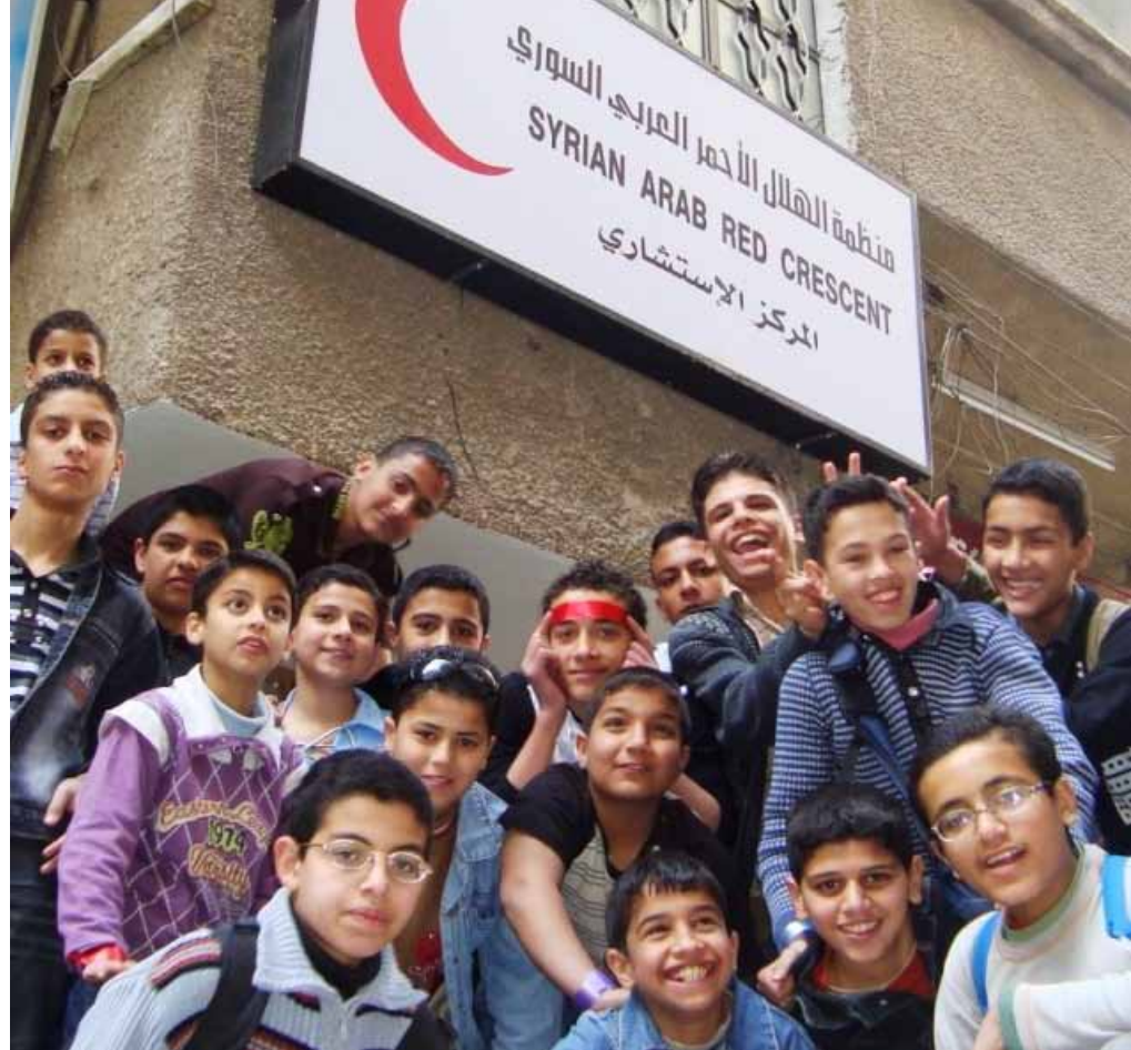
La puerta principal del Centro Social del Damasco rural, en Seiday Zaynab. Esta área es una de las que tiene mayor concentración de refugiados iraquíes. Los adolescentes visitan mucho el centro.

Aunque aún es pronto para medir el impacto de los centros, múltiples indicios evidencian que ya están ayudando a mejorar la capacidad de recuperación y el bienestar psicosocial de los refugiados. Como una de las usuarias de uno de los centros dijo: “La percepción que tengo de mí misma ha mejorado, mi vida ha cambiado... Incluso mi forma de vestir ha cambiado”. Las refugiadas iraquíes viven a menudo prácticamente aisladas y confinadas en sus apartamentos. Para muchas mujeres, los centros son el primer lugar donde han podido relacionarse con otros compatriotas fuera de casa. Una mujer explicaba la diferencia entre estar en casa y en el centro: “En casa me pongo nerviosa