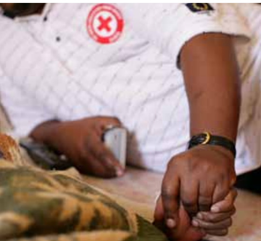
APS como parte de los cuidados domiciliarios basados en la comunidad, Pretoria, Sudáfrica.

Por último, la SCRS renovará su memorandum de entendimiento con proveedores de servicios clave en el sector del apoyo psicosocial, lo cual incluirá visitas de monitoreo a sitios del proyecto, evaluación de los aspectos y actividades de la asociación de todas las intervenciones planificadas. Hay mucho que esperar. ■