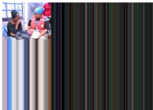
Izquierda: consejeros voluntarios de la SCRU escuchan al familiar de una de las víctimas de los estallidos de bombas en el centro de apoyo psicosocial establecido en el hospital nacional de referencia Mulago en Kampala. Derecha: voluntarios del Equipo de Acción de la Cruz Roja de Uganda en la Filial Norte de Kampala en la sección de víctimas del hospital nacional de referencia Mulago.

El lanzamiento de la respuesta psicosocial a este desastre es una de las actividades que ha emprendido la SCRU. Con el apoyo de amigos profesionales de la Cruz Roja de Kenia, un total de 15 consejeros profesionales fueron constituidos en equipos, orientados acerca de la tarea de ser desplegados a varios centros para ofrecer apoyo psicosocial. Uno de esos equipos estuvo asignado permanentemente al Hospital de Mulago, con cinco consejeros para ofrecer apoyo a los dolientes amigos y familiares de los fallecidos, tanto al momento del anuncio del fallecimiento como en la morque. De inmediato se