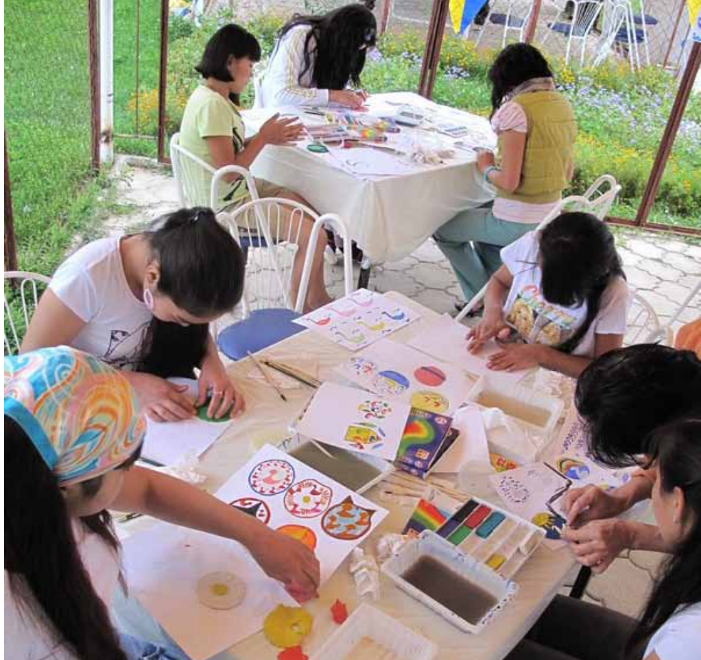
Niños y jóvenes de las regiones de Osh y Jalal-Abad, áreas afectadas por el conflicto en junio, durante el campamento de rehabilitación de verano en el lago Issyk-Kul lake.

A medida que se acercan el otoño y el invierno, las familias y las comunidades se sienten cada vez más ansiosos y desde ya están luchando para asegurarse una