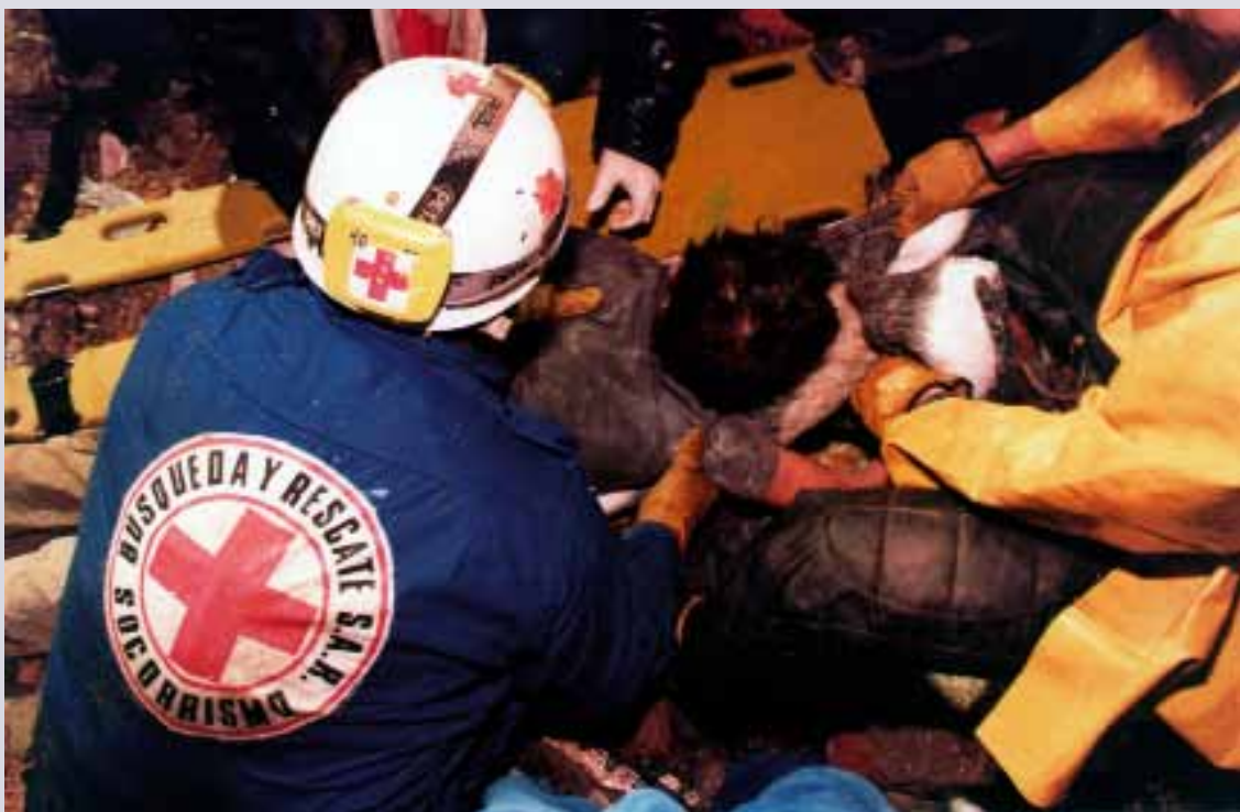
Luego del terremoto que afectó aproximadamente 4.8 kilómetros cuadrados de plantaciones de café el 25 de enero de 1999, 400 voluntarios de la Cruz Roja Colombiana participaron en las actividades de rescate para sacar a las víctimas de las ruinas y transportar a los heridos al centro médico de la región.

El apoyo psicosocial para los voluntarios se formaliza en la política de apoyo psicosocial de la Sociedad Nacional. Aquí, dos grupos meta han sido definidos: las personas afectadas por emergencias, desastres o violencia o viviendo en condiciones de vulnerabilidad y el personal involucrado en las intervenciones humanitarias. Incluso establece que el apoyo psicosocial debe ser hecho a la medida para ajustarse a las necesidades de las personas involucradas, y que debe brindarles apoyo durante la adaptación a