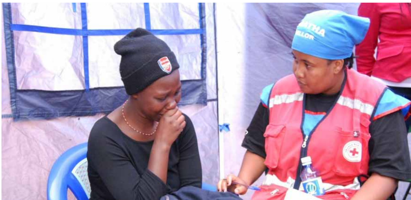
Ejercicio de fortalecimiento de equipo en la Sede Central de la Cruz Roja de Kenia luego de la respuesta a la tragedia del incendio.

y ebanistería, equipo de peluquería y computadores para facilitar las capacitaciones que pueden servir como una estrategia para el mejoramiento de la integración de la comunidad.