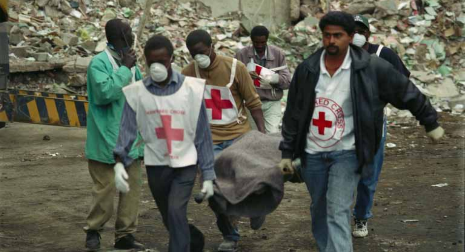
Rescatistas de la Cruz Roja de Kenia realizan una búsqueda en el lugar del estallido de la bomba en Nairobi.

revisar el rango de los materiales existentes, tanto para tener una idea de lo que está disponible como de la calidad.