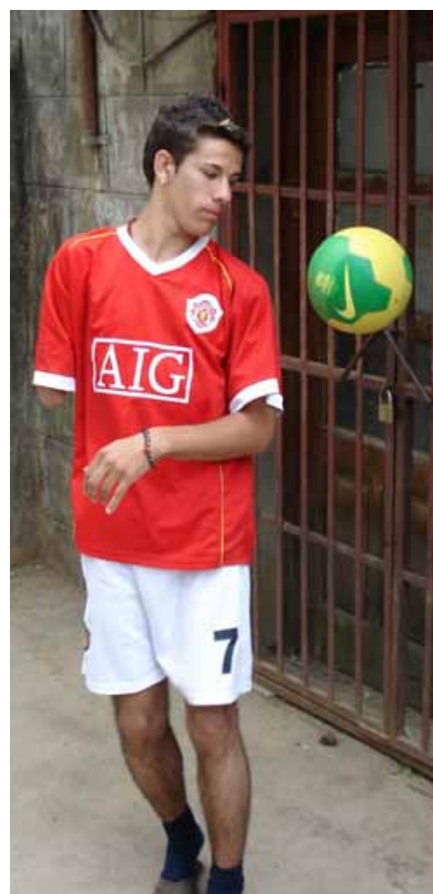
Un joven de 17 años demuestra sus habilidades en el control del balón, Serbia y Montenegro (2007).

Tal como muestran estos proyectos y muchas otras intervenciones psicosociales en diferentes lugares del mundo, las actividades guiadas de deportes y juego pueden ayudar a las personas a afrontar los impactos de una crisis, llevando a una serie de positivos beneficios físicos, psicológicos, psicosociales y de salud social. Las actividades de deportes y juegos pueden ayudar a nivel psicosocial y social a construir el trabajo en equipo, el respeto por los demás, la tolerancia y la aceptación de las reglas. A manera de juego, ayuda a fomentar un espíritu de equipo, a construir confianza y respeto mutuo, y puede reconstruir la cohesión social. Por lo tanto, no ha de sorprender que la educación a través de los deportes tenga también cabida en la reconciliación de conflictos. Por ejemplo, un