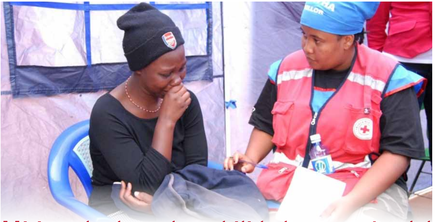
Una voluntaria de la Cruz Roja de Kenia durante una emotiva sesión con una persona en duelo.