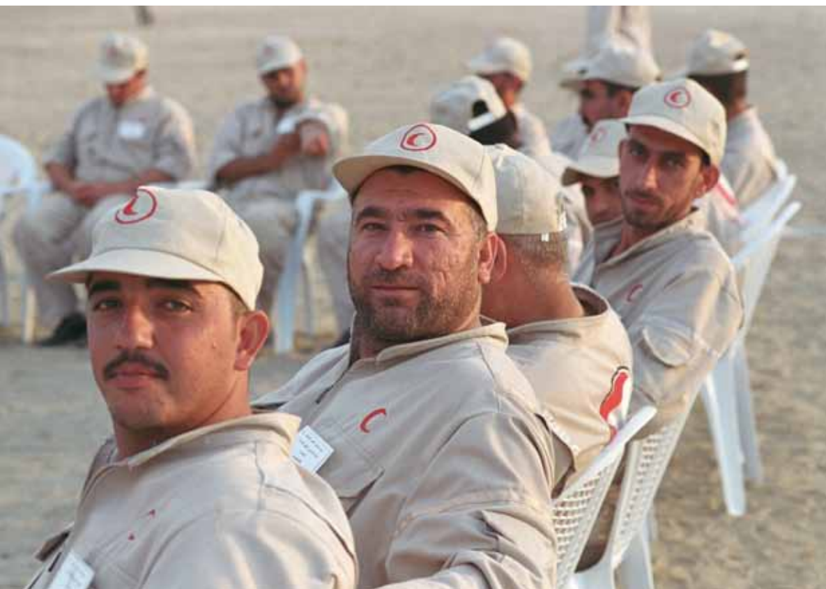
120 voluntarios de las 18 filiales de la Sociedad de la Media Luna Roja Iraquí (SMLRI) completaron un ejercicio humanitario de cinco días de duración como parte de sus esfuerzos en preparación ante desastres.

La meta del Centro para el AS es la de establecer estándares mundiales, y desarrollar productos y servicios para formar un sistema completo de apoyo psicosocial para los voluntarios. Para poder lograrlo, es crucial entender la manera en la que las Sociedades Nacionales abordan actualmente las necesidades de los voluntarios, para tener clara la mejor manera de fortalecer las capacidades de las respectivas Sociedades. Por lo tanto, el primer paso en este proceso fue el de desarrollar un informe indicativo de la situación. El informe fue llevado a cabo con un objetivo de tres frentes. Primero, evaluar las necesidades percibidas de las Sociedades Nacionales y los voluntarios en términos de apoyo psicosocial durante las emergencias, así como la medida en la cual la que el apoyo se ofrece realmente y se encuentra disponible. En segundo lugar, el objetivo era identificar diferentes instrumentos de apoyo psicosocial disponibles para los voluntarios, y en tercer lugar analizar las evalua-