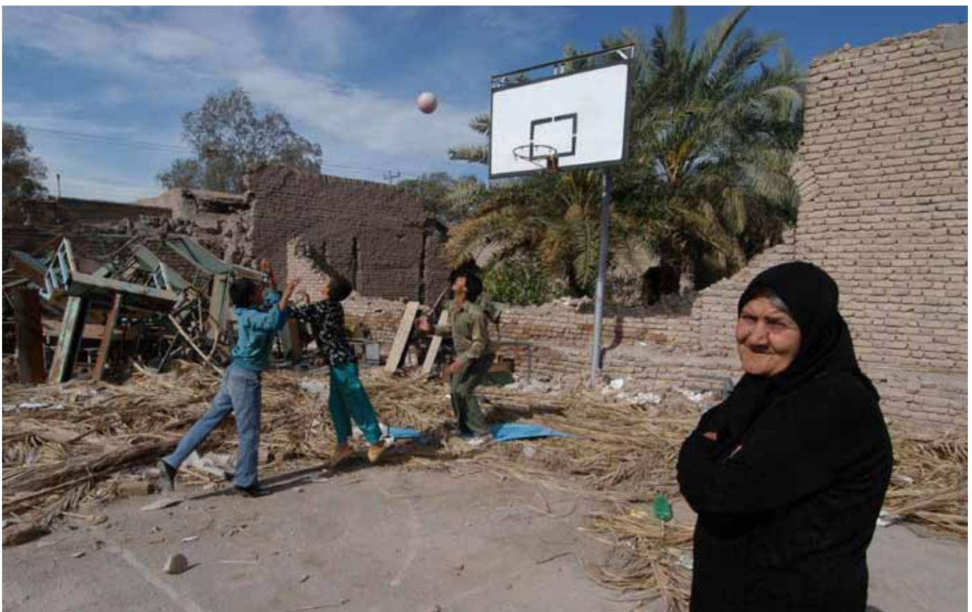
Irán. Niños jugando básquetbol en la completamente destruida ciudad de Bam luego del terremoto (2004).