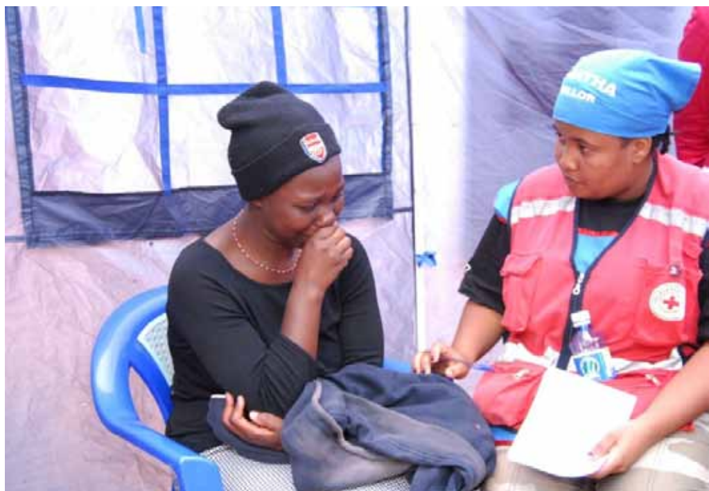
Los sobrevivientes de las inundaciones en la Región Central asisten a una sesión de charla con un consejero..

como en la morgue de la ciudad. La tienda de campaña era como un panel de actividades y a veces era abrumador para los consejeros, quienes trabajaban turnos de 20 horas durante cinco días seguidos. La confusión, la angustia, la desesperación, la histeria, la rabia y las amenazas suicidas caracterizaron todo el período, requiriendo las mejores destrezas en consejería en casos de trauma para calmar a los airados dolientes y sobrevivientes a medida que los cuerpos eran sacados uno tras otro y llevados a la morgue