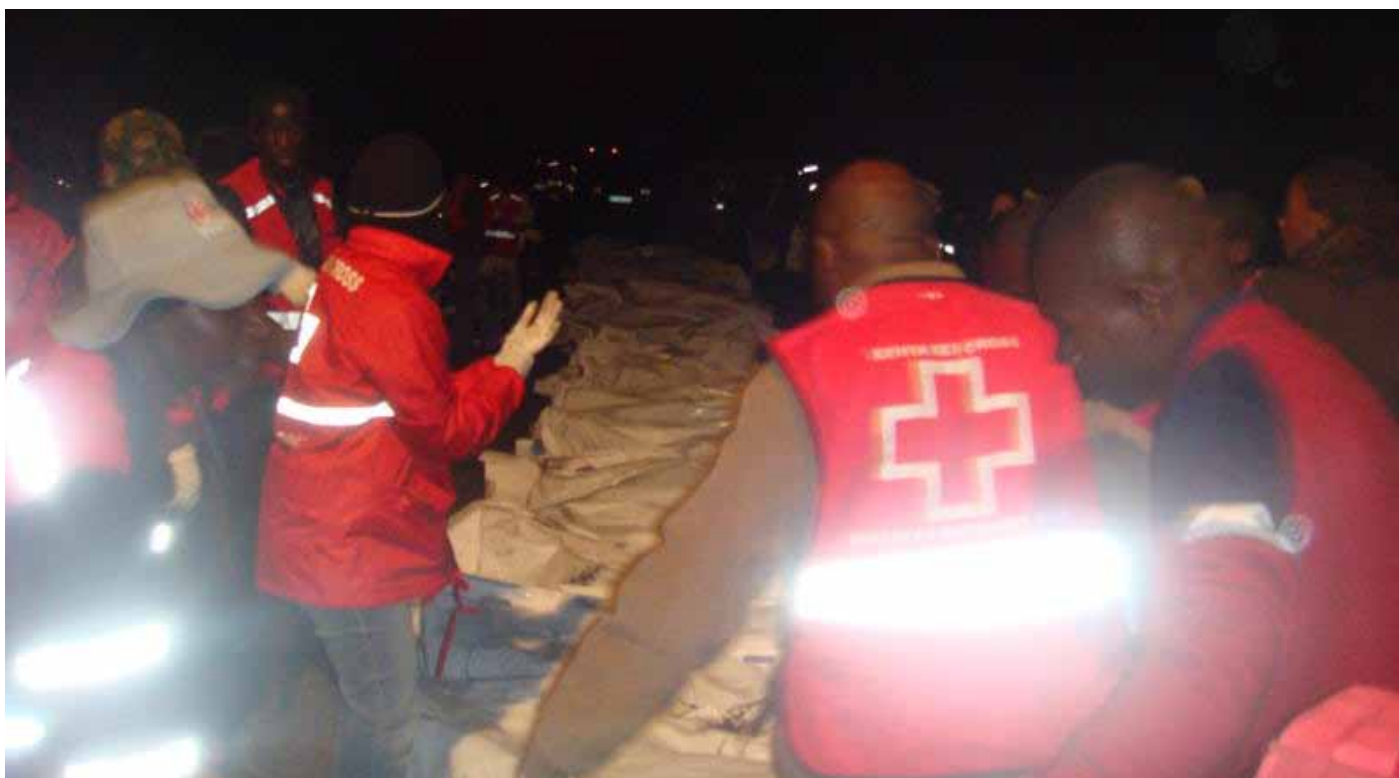
El Equipo de Rescate de la Cruz Roja de Kenia prepara cuerpos para un entierro masivo..