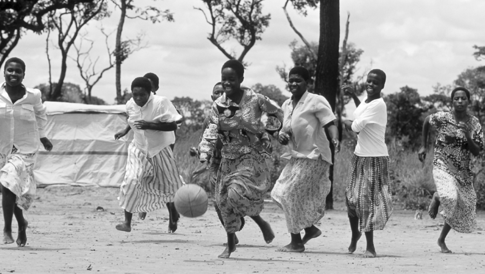
Refugiados congoleños (RDC) Campamento Kala, Kawambwa, Zambia (2003).

proyecto de co-existencia basada en los deportes para niños judíos y árabes en la región de Galilea del norte de Israel muestra que los deportes y la actividad física pueden proporcionar oportunidades para el contacto al otro lado de las fronteras y promover la existencia pacífica y respetuosa. El potencial de los deportes no es nuevo para los científicos del deporte, pero finalmente ha recibido reconocimiento por parte de las organizaciones gubernamentales y humanitarias. En el 2003, el Consejo de Europa resaltó la contribución de los deportes al alivio de las consecuencias de los desastres humanitarios a través de los llamados Ballon Rouges , que "las actividades y juegos deportivos juegan un importante papel, especialmente ayudando a los niños y a los jóvenes a afrontar el trauma que han experimentado." El Ballon Rouges es un proyecto del Consejo de Europa, sus Estados miembros y otras organizaciones internacionales, el cual fue adoptado por el Comité de Ministros. Con la idea de acercar los deportes y la educación a las vidas de las personas jóvenes desplazadas internamente, tiene como fin comunicar los valores fundamentales de los deportes, tal como el juego limpio, la co-operación, el compartir y el respeto,