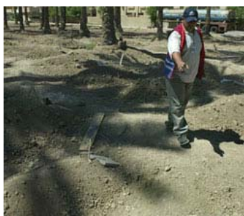
Todos los días los voluntarios de la Media Luna Roja cumplen la dura tarea de recuperar y sepultar los cadáveres.

Un equipo multinacional y multisectorial de evaluación de la Federación Internacional realizó recientemente una visita a Iraq, devastado por la guerra. A pesar de los graves problemas de seguridad, el equipo logró visitar 16 de las 18 filiales. Si algo se pudo comprobar, es que los voluntarios de la Media Luna Roja de Iraq constituyen un recurso valioso para todas las actividades de socorro a lo largo del país.