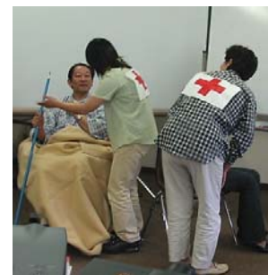
Psicodrama a cargo de algunos participantes del taller de formación de formadores.

Estos dos últimos oradores también habían sido designados por el Centro de Información sobre Apoyo Psicológico para actuar como facilitadores, durante los cinco días siguientes, en el taller de formación de formadores dentro de la Cruz Roja Japonesa. El Seminario de la Cruz Roja Japonesa realizado en el Lago Kawaguchiko cerca del Monte Fuji reunió a 32 participantes de todo el país: 23 enfermeras, 5 psicólogos, 2 médicos de hospitales de la Cruz Roja Japonesa y 2 profesores de escuelas universitarias de enfermería de la Cruz Roja Japonesa. El programa siguió el manual de formación "Apoyo psicológico basado en la comunidad" (para una descripción del contenido del manual, ver el No. 1/2003 de Reaccionar ante la crisis ). Dado que el manual es una herramienta genérica utilizada por diferentes sociedades y culturas, debatimos en detalle cómo aplicar los módulos específicamente en el contexto japonés.