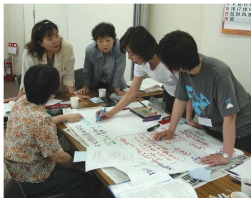
Trabajo en grupo.