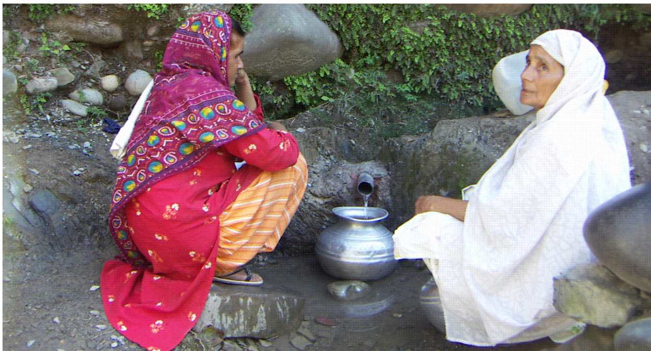
Ir a por agua al río para uso doméstico es una actividad habitual que realizan las mujeres. Se trata de una oportunidad de relacionarse socialmente.

La evaluación de necesidades, aunque se centraba en las personas mayores, también incluía la evaluación de la población super-