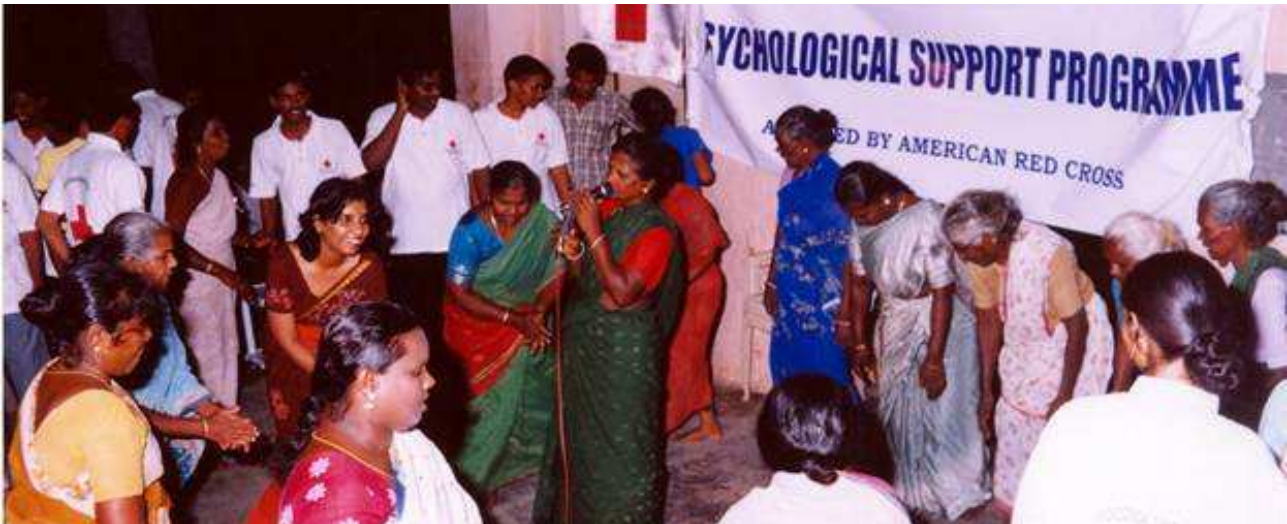
Profesoras participando en el desarrollo de actividades creativas y expresivas para niños

pervivientes generan una actitud positiva hacia el proceso, hacia ellos mismos –de forma individual y colectiva– y hacia su nuevo “lugar”; y han influido en el desarrollo del bienestar ambiental, psicosocial y psíquico. La salud, el agua y los elementos sanitarios del modelo pueden cambiar la percepción de los supervivientes de una posición en que reclaman un sentido de “lugar” a otra en la que desean obtener una comunidad segura y saludable.