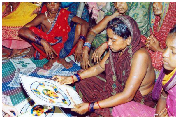
Mujeres leyendo información de un cartel sobre "Seguridad doméstica" en una sesión participativa de la comunidad.

El modelo integrado, que planifican en la actualidad la IRCS y la ARC, se basa en actividades como la cartografía comunitaria,