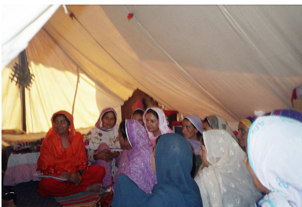
Mujeres participando en una evaluación. El enfoque de la evaluación se basaba en la participación de la comunidad y se llevaba a cabo partiendo de la premisa de que el propio proceso de evaluación podía curar y capacitar, así como de que era el método más adecuado para determinar qué enfoques eran necesarios y más útiles.

Se hizo hincapié en enfoques eficaces para los ancianos. Entre los participantes en la formación y en las consultas de seguimiento figuraba el personal médico de Merlin –que ofreció servicios en los campamentos de IDP y en sedes de asistencia social–, profesionales de Helpage, personal administrativo y de dirección de servicios sociales y de salud mental de otras ocho ONG locales e internacionales –que siguen ofreciendo servicios en las zonas de influencia–, el personal de la Oficina de Salud de la Región Pakistání y, lo que es más importante, líderes de los campamentos y pueblos locales, líderes religiosos, profesores, trabajadores sociales, sanitarios, y otros cuidadores autóctonos.