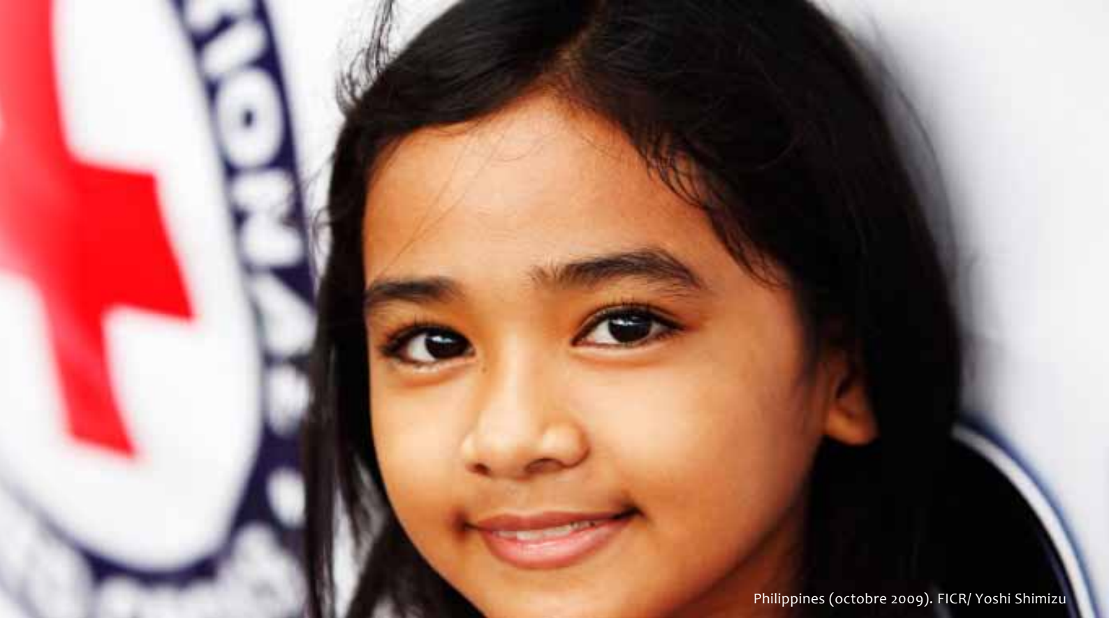
Philippines (octobre 2009).

une action psychosociale qui influencera les attitudes face à la violence dans certains milieux”. L’objectif inclut une reconnaissance importante des interventions psychosociales qui peuvent aider à promouvoir la communication inter-culturelle et la compréhension, et ainsi rétablir la confiance au sein des communautés. Dans ce contexte, le soutien psychosocial est perçu comme un outil de promotion de l’intégration sociale.