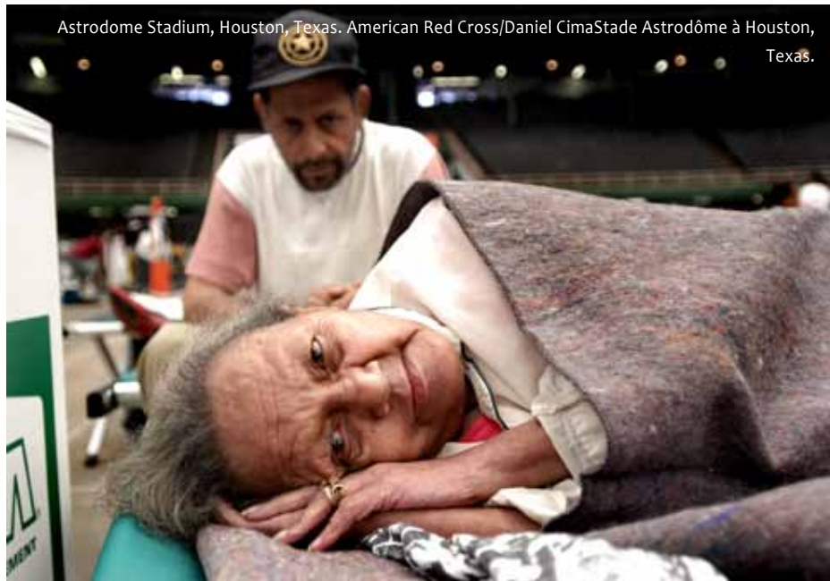
Astrodome Stadium, Houston, Texas.Stade Astrodôme à Houston, Texas.

Ils ont trouvé que l'approche typique post-catastrophe des intervenants était de pourvoir à un soutien psychosocial de base. En effet, l'évaluation de PRO a montré qu'il y avait plusieurs programmes de cette nature mais pas de programme qui offrait un suivi clinique pour ceux qui en avaient besoin. Parmi cette population affectée, nombreux ne pouvaient pas financer un tel suivi. De plus, les assurances médicales, historiquement, ne couvraient qu'un suivi minime des interventions en santé mentale, comparativement aux autres interventions médicales pour les problèmes physiques. Par ailleurs, ce suivi n'était pas évident, même pour des personnes ayant une police d'assurance adéquate, car ils ne souhaitaient pas l'utiliser par peur que leurs employeurs