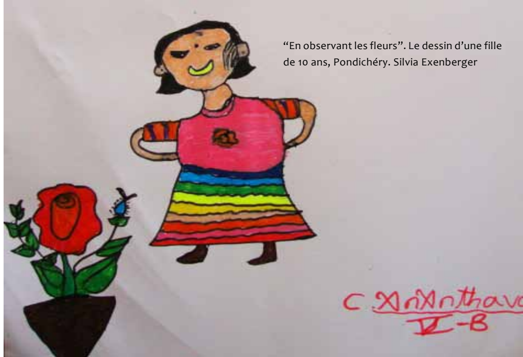
"En observant les fleurs". Le dessin d'une fille de 10 ans, Pondichéry.